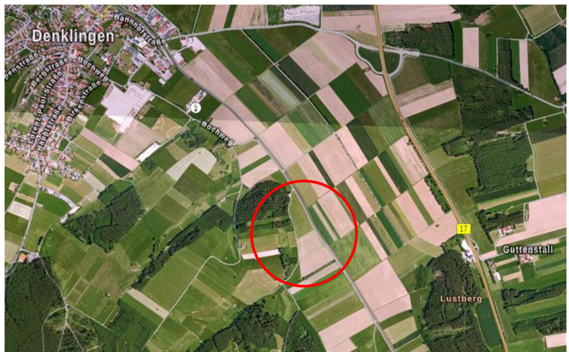
Abb. 2 Plangebiet, ohne Maßstab, Stand 10.01.2022

Mit der 35. Änderung des Flächennutzungsplanes wird der östliche Teil des Änderungsbereichs als „Sonstiges Sondergebiet Photovoltaik“ dargestellt, der westliche Teil bleibt Fläche für die Landwirtschaft – Ausgleichsfläche.