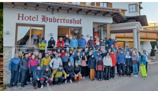
SKI-WOCHENENDE IN SÜDTIROL VFL Denklingen