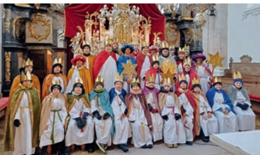
STERNSINGER 2025 „Sternsingen für Kinderrechte“