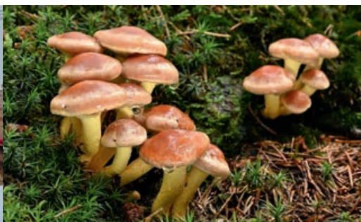
GARTLER & NATURBEGEISTERTE Winterpilzführung