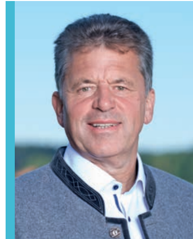
Andreas Braunegger Erster Bürgermeister

Auf dem Grundstück Fl.Nr. 1798 (Gegenüber dem Baugebiet: An den Linden) der Gemarkung Denklingen befinden sich drei Regenbecken, in die das Niederschlagswasser aus dem Regenwasserkanal läuft.